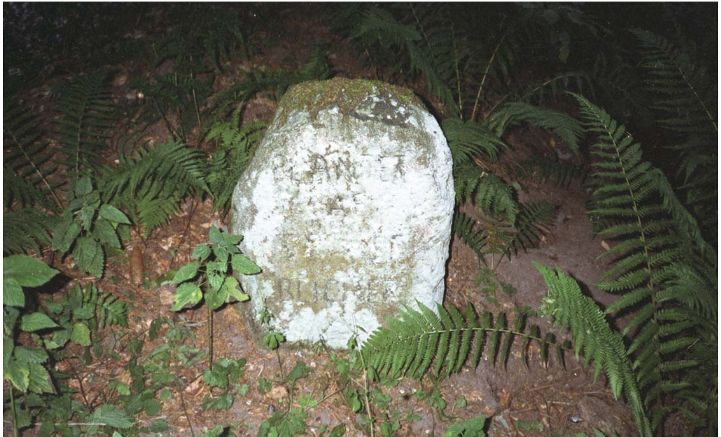
Steen St. Blicher-stenen

Fra 1916 til 1960 var der central i byen, ligeledes var der tidligere både købmand, smedie, tømrer og et lille brødudsalg.