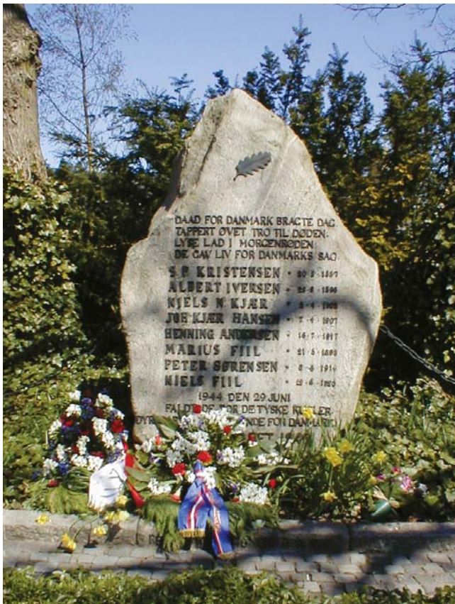
Mindestenen i Hvidsten

Medbragte hunde skal være i snor og turen må ikke foretages i jagtsæsonen.